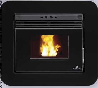
NEVA + M-94

Puerta en cristal vitrocerámico serigrafiado color negro. Screen-printed black glass door. Porta de vidro vitrocerámico serigrafada cor preta. Porta in vetro ceramico serigrafato nero. Porte en vitre vitroceramique sérigraphié noir.