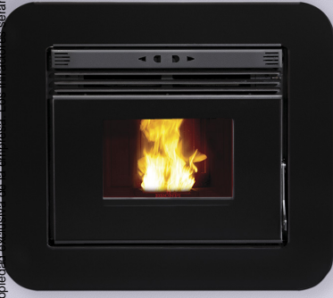
NEVA + M-94

Puerta en cristal vitrocerámico serigrafiado color negro. Screen-printed black glass door. Porta de vidro vitrocerámico serigrafada cor preta. Porta in vetro ceramico serigrafato nero. Porte en vitre vitrocéramique sérigraphié noir.