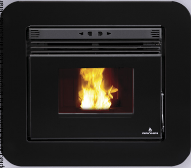
NEVA + M-94

Puerta en cristal vitrocerámico serigrafiado color negro. Screen-printed black glass door. Porta de vidro vitrocerámico serigrafada cor preta. Porta in vetro ceramico serigrafato nero. Porte en vitre vitroceramique sérigraphié noir.